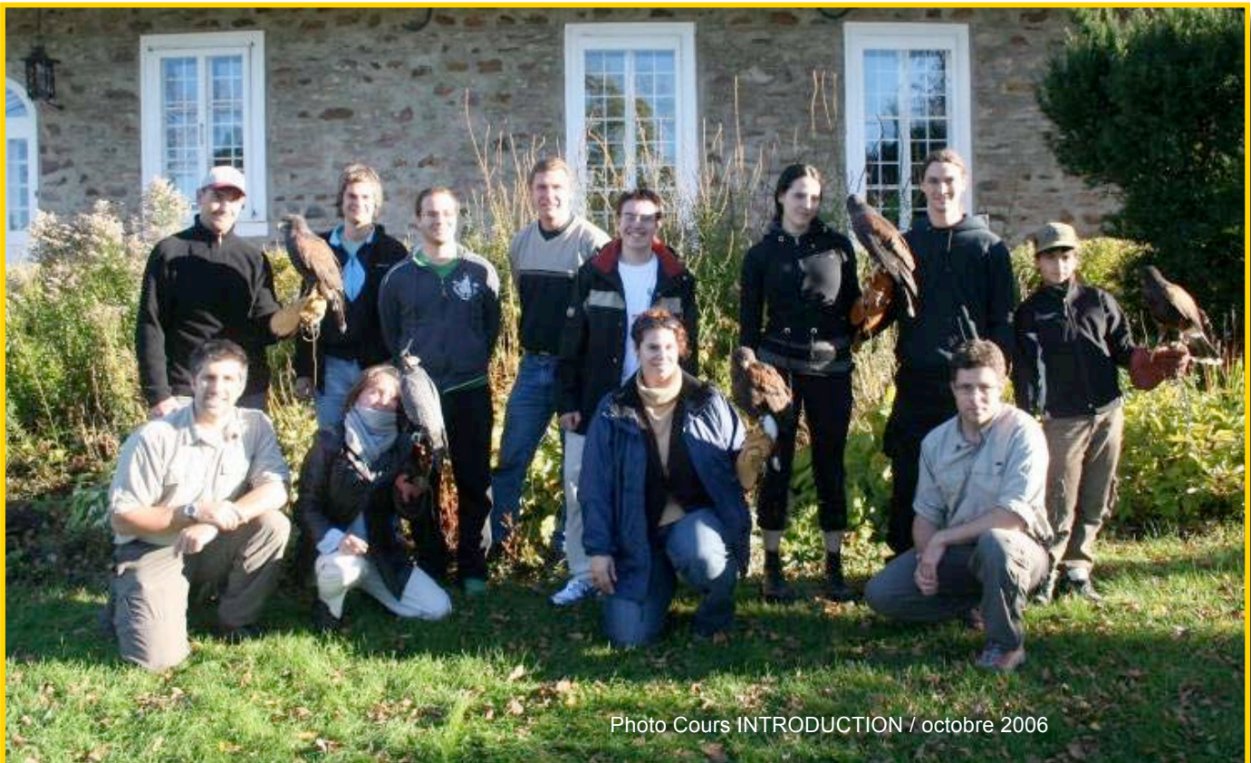
Photo Cours INTRODUCTION / octobre 2006

SEF a à cœur la pratique de la fauconnerie de façon sérieuse et avec éthique. Pour cette raison, nos cours s'adressent aux gens qui partagent cette même vision. La qualité de notre service, la sécurité, le respect, et les soins aux oiseaux sont nos priorités.